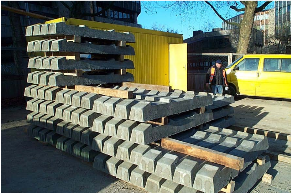
Schwellen ohne Stützpunktmontage zur Komplettierung mit gestaffelten Federkennziffern für Übergänge