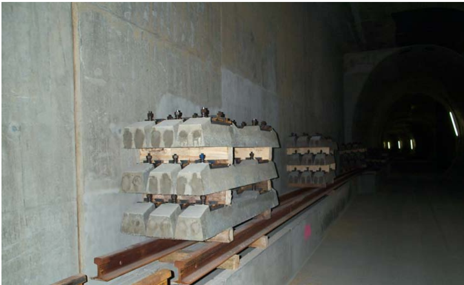
Im Tunnel verteilte Schwellen mit vormontierten RST - Stützpunkten (14.12.2004)