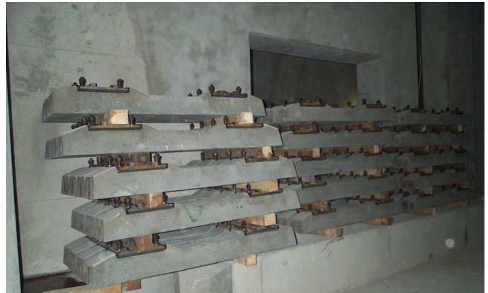
Im Tunnel verteilte Schwellen mit vormontierten RST - Stützpunkten (14.12.2004)